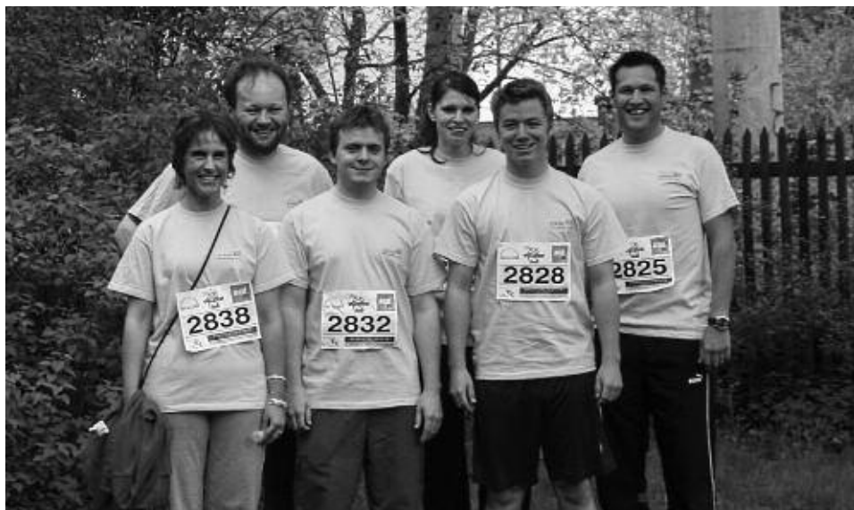
Das STEDO-Team – hier beim Nürnberger Firmenlauf – ist immer für euch da.

Herausgeber und V.i.S.d.P: STEDO Assekuranzbüro GmbH Ostendstraße 198 90482 Nürnberg Tel.: 0911/954 19 95 Fax: 0911/954 19 99 E-Mail: info@stedo.com